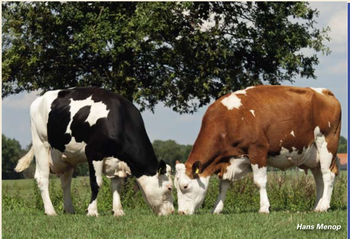
Fleckvieh kruislingen realiseren het hoogste saldo.