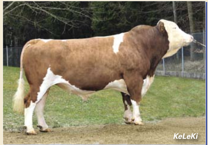
BFG Zaspot fokt goed bewaarde 3e kalfskoeien met uitstekende uiers.