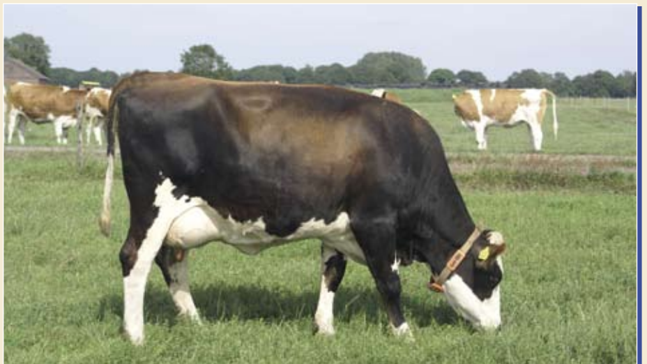
Montedochter Ada 47 begint met 121LW. De stier Monte valt steeds meer op doordat hij zulke sterke en laatrijpe koeien geeft.