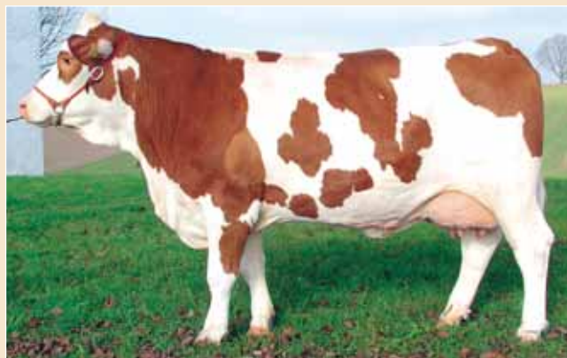
BFG Varus is een pinkentier met ruim +1100 kg melkvererving. Op de foto Varusdochter Leone met een dagproductie van 32.7 kg melk.