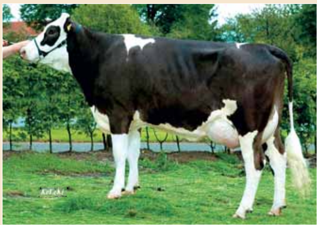
BFG Hippo stijgt in populariteit vanwege zijn gebruik op pinken, de geweldige melkvererving en de sterke benen- en uierverving. Op de foto Hippodochter Tina (50% Fleckvieh) met een vaarzenlijst 305 – 9773 – 3.69 – 3.43.

Op Holsteinkoeien zorgt Hippo voor de nodige variatie in type, uiteenlopend van bespierde tot melktypische koeien. Maar alle zijn laatrijp en duurzaam, voorzien van beste klauwen en benen en extra lange vooruiers (130). De Hippodochters zijn in de meeste gevallen vlot te melken met een enkele langzaam melkende koe.